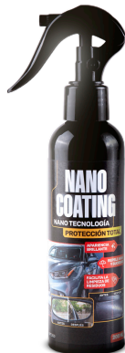
NANO COATING NANO TECNOLOGÍA PROTECCIÓN TOTAL PRESENT: 200 ML