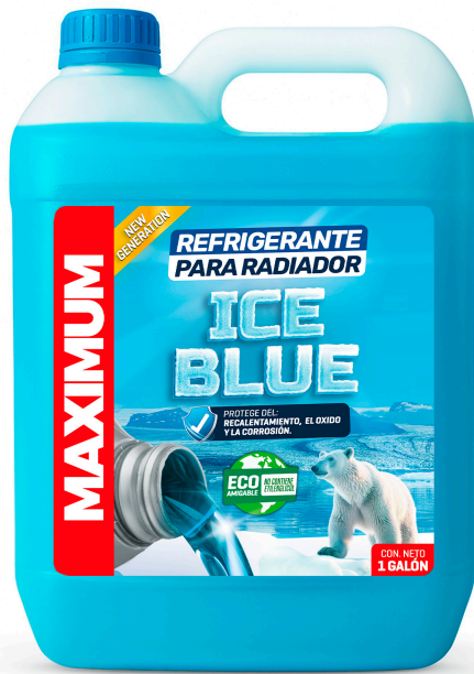
REFRIGERANTE PARA RADIADOR ICE BLUE NO CONTIENE ETILENGLICOL PRESENT: 1 GAL