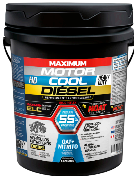
MOTOR COOL DIESEL ROJO REFLEX 55% 1 GAL - 5 GAL