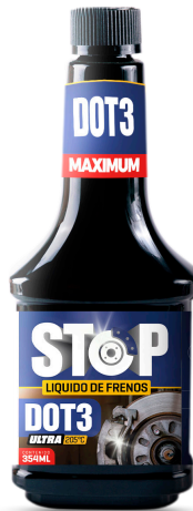
STOP DOT3 ULTRA LIQUIDO DE FRENOS 205°C 354 ML