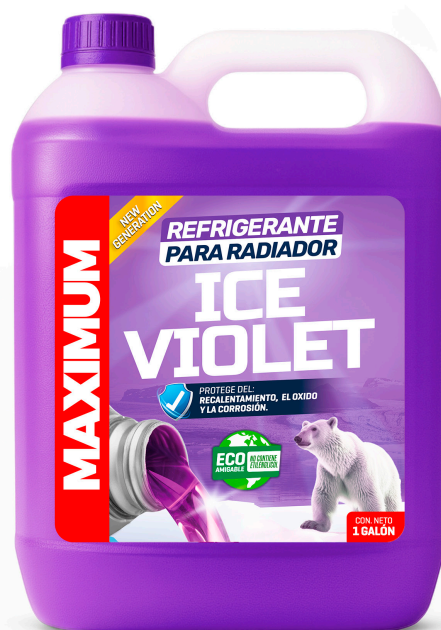
REFRIGERANTE PARA RADIADOR ICE VIOLET NO CONTIENE ETILENGLICOL PRESENT: 1 GAL