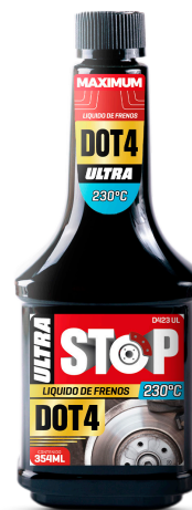
STOP DOT4 ULTRA LIQUIDO DE FRENOS 230°C 354 ML