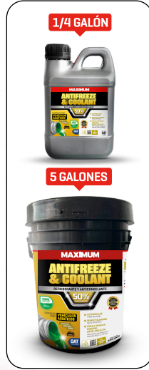
ANTIFREEZE & COOLANT VERDE REFLEX 50% PRESENT: 1/4 GAL - 1 GAL - 5 GAL