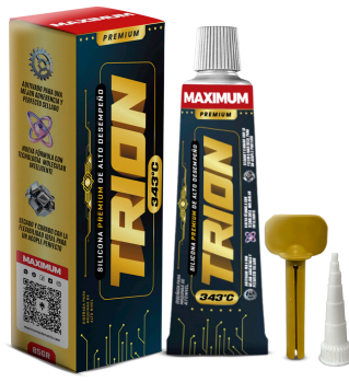
TRION MAXIMUM SILICONA PARA EMPAQUETADURA PREMIUM 85 GR