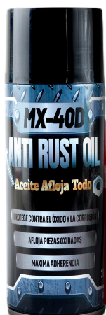
ANTI RUST OIL ACEITE AFLOJA TODO ANTIOXIDO 311 GR