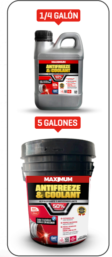
ANTIFREEZE & COOLANT ROJO REFLEX 50% PRESENT: 1/4 GAL - 1 GAL - 5 GAL