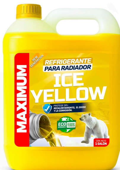
REFRIGERANTE PARA RADIADOR ICE YELLOW NO CONTIENE ETILENGLICOL PRESENT: 1 GAL