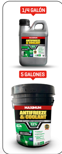
ANTIFREEZE & COOLANT VERDE REFLEX 33% PRESENT: 1/4 GAL - 1 GAL - 5 GAL