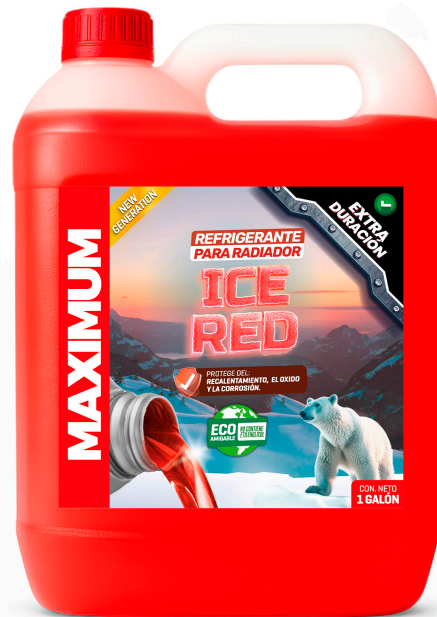
REFRIGERANTE PARA RADIADOR ICE RED NO CONTIENE ETILENGLICOL PRESENT: 1 GAL