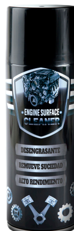
ENGINE SURFACE CLEANER LIMPIADOR DE MOTOR Y DESENGRASANTE 311 GR