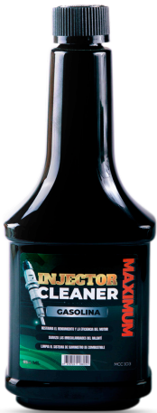
INJECTOR CLEANER LIMPIA INYECTORES GASOLINA 354 ML