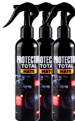
SILICONA PROTECTOR TOTAL MATE PRESENT: 236 ML FRUTAL LIMÓN OCEANO