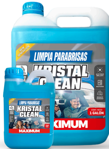
KRISTAL CLEAN LIMPIA PARABRISAS PRESENT: 1/4 GAL - 1 GAL