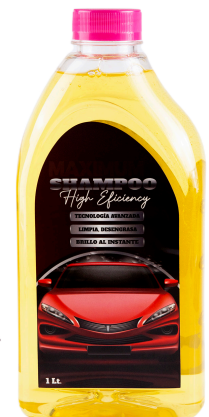
SHAMPOO HIGH EFFICIENCY SHAMPO BRILLO PRESENT: 1 LITRO