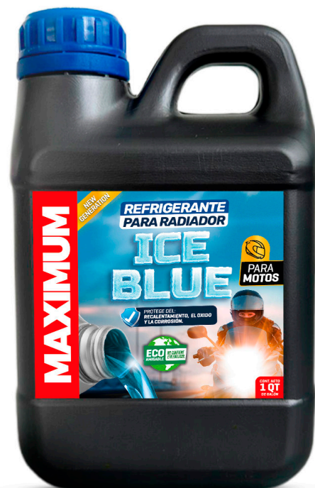
REFRIGERANTE PARA RADIADOR ICE BLUE NO CONTIENE ETILENGLICOL PRESENT: 1 /4 GAL