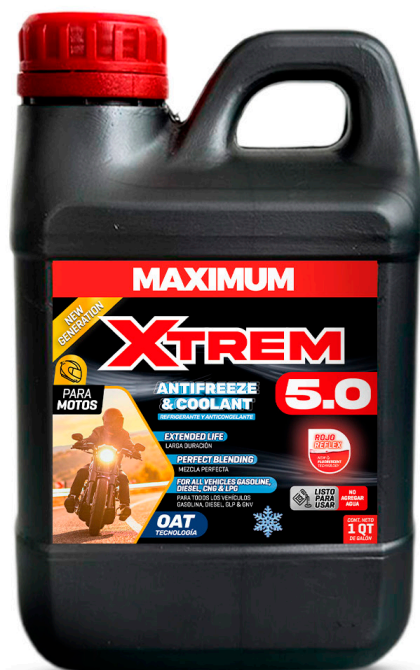
ANTIFREEZE & COOLANT XTREM 5.0 ROJO REFLEX PRESENT: 1 /4 GAL