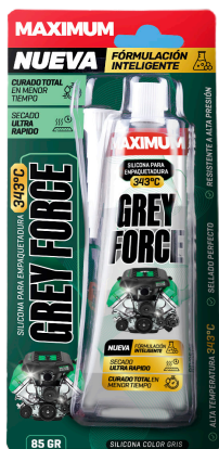
GREY FORCE SILICONA PARA EMPAQUETADURA 85 GR