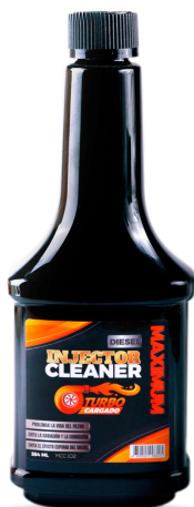
INJECTOR CLEANER LIMPIA INYECTORES DIESEL 354 ML