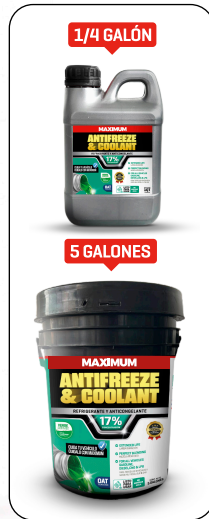
ANTIFREEZE & COOLANT VERDE REFLEX 17% PRESENT: 1/4 GAL - 1 GAL - 5 GAL