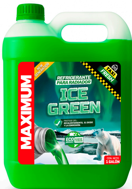
REFRIGERANTE PARA RADIADOR ICE GREEN NO CONTIENE ETILENGLICOL PRESENT: 1 GAL