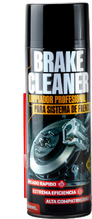
BRAKE CLEANER LIMPIADOR PARA SISTEMA DE FRENOS 500 ML