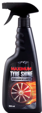
TYRE SHINE ABRILLANTADOR DE LLANTAS PRESENT: 500 ML