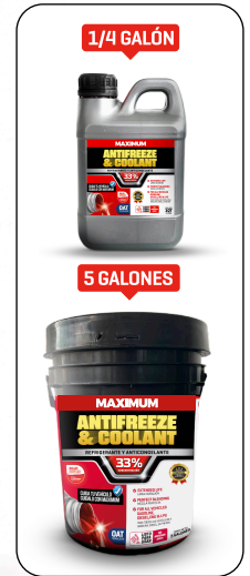
ANTIFREEZE & COOLANT ROJO REFLEX 33% PRESENT: 1/4 GAL - 1 GAL - 5 GAL