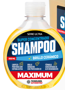
SHAMPOO SUPER CONCENTRADO BRILLO CERÁMICO 350ML - 19 LITROS