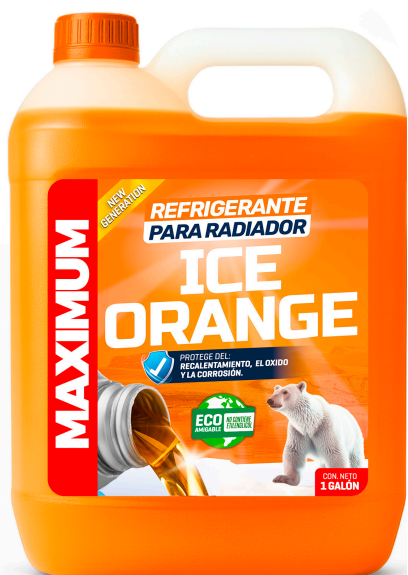
REFRIGERANTE PARA RADIADOR ICE ORANGE NO CONTIENE ETILENGLICOL PRESENT: 1 GAL