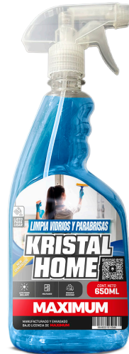
KRISTAL HOME LIMPIA VIDRIO Y PARABRISAS PRESENT: 650 ML