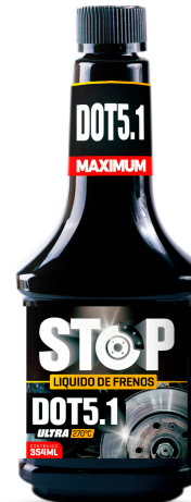
STOP DOT5.1 ULTRA LIQUIDO DE FRENOS 254°C 354 ML