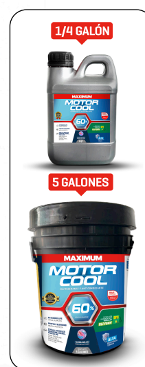
MOTOR COOL VERDE REFLEX 60% 1/4 GAL - 1 GAL - 5 GAL