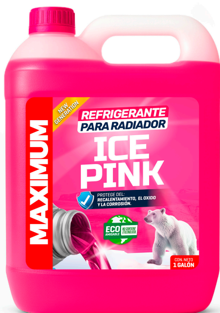
REFRIGERANTE PARA RADIADOR ICE PINK NO CONTIENE ETILENGLICOL PRESENT: 1 GAL