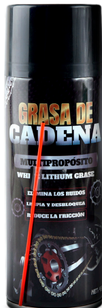
SPRAY GRASA DE CADENA DE LITHIUM MULTIUSO 450 GR