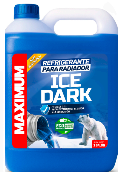
REFRIGERANTE PARA RADIADOR ICE DARK NO CONTIENE ETILENGLICOL PRESENT: 1 GAL