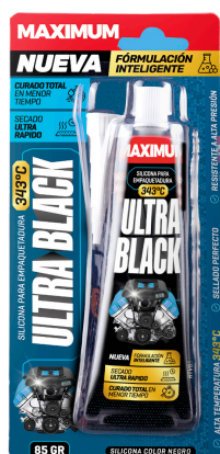
ULTRA BLACK SILICONA PARA EMPAQUETADURA 85 GR