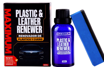
PLASTIC & LEATHER RENEWER RENOVADOR DE PLASTICO Y CUERO PRESENT: 30 ML