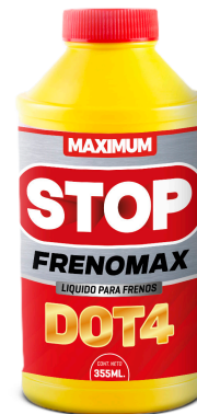
STOP FRENOMAX DOT4 LIQUIDO DE FRENOS 355 ML